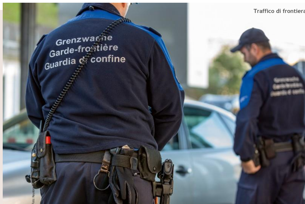
Traffico di frontiera

I punti che seguono intendono illustrare gli aspetti del diritto doganale che riguardano i cacciatori in viaggio oltre confine con armi e munizioni proprie per la partecipazione ad un evento di caccia. Si prega di